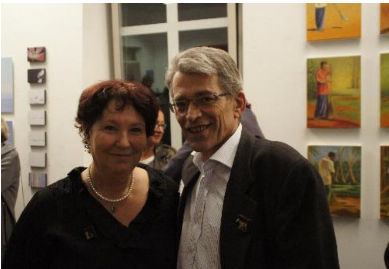
mit Sepp Dürr Kulturpolitischer Sprecher der Grünen im Landtag